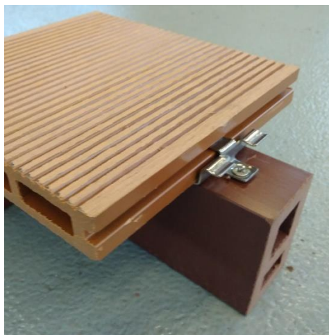
Obr. č. 4: Ukázka použití kotvící spony průběžné

Pro upevnění posledního prkna je opět potřeba použít kotvící sponou zahajovací/ukončovací stejně jako na začátku.