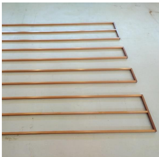
Obr. č. 1: Rozložení pokladových hranolů (nosičů) s mezerami pro stahování terasy

U namáhaných teras nebo chodníků (např. v komerčních prostorech) je třeba volit ještě menší než v tab. č. 1 doporučenou maximální vzdálenost mezi podkladovými hranoly.