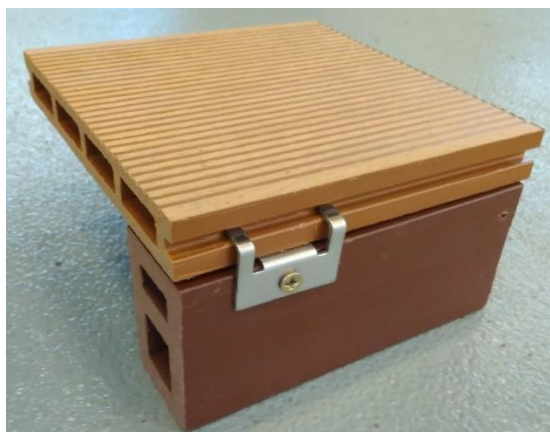
Obr. č. 3: Ukázka použití kotvící spony zahajovací/ukončovací

Přichycení vnějších okrajů první a poslední řady terasových prken se provádí kotvící sponou zahajovací/ukončovací. Tato spona se přišroubuje vrutem na hranu nosiče. Všechny otvory pro vruty si vždy předem předvrtejte. Prkno se pak zasune do spony drážkou na boční straně prkna. Spony umísťujte ve vzdálenosti minimálně 20 mm od okraje hranolu, aby nedošlo k uštípnutí konce hranolu při vrtání. Je nutné upevnění prkna pomocí těchto kotvících spon ke každému nosiči, se kterým se na obvodu terasy setkává.