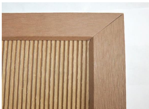
Obr. č. 5: Ukázka použití zakončovací lišty

Při montáži zakončovací lišty postupujte dle typu lišty. Změřte přesnou délku terasy a podle této délky seřízněte zakončovací lištu na obou stranách, aby lišty v rohu dohromady svíraly pravý úhel (je-li terasa do pravého úhlu). Totéž proveďte u všech ostatních stran terasy. Připevnění proveďte vhodným lepidlem.